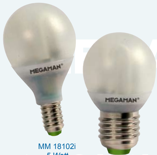
MM 18102i 5 Watt